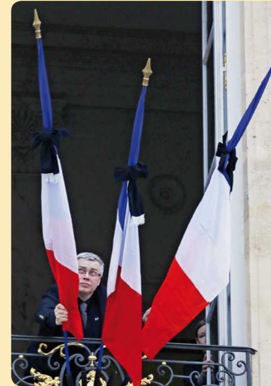
Cet homme plie des drapeaux au palais de l'Élysée.