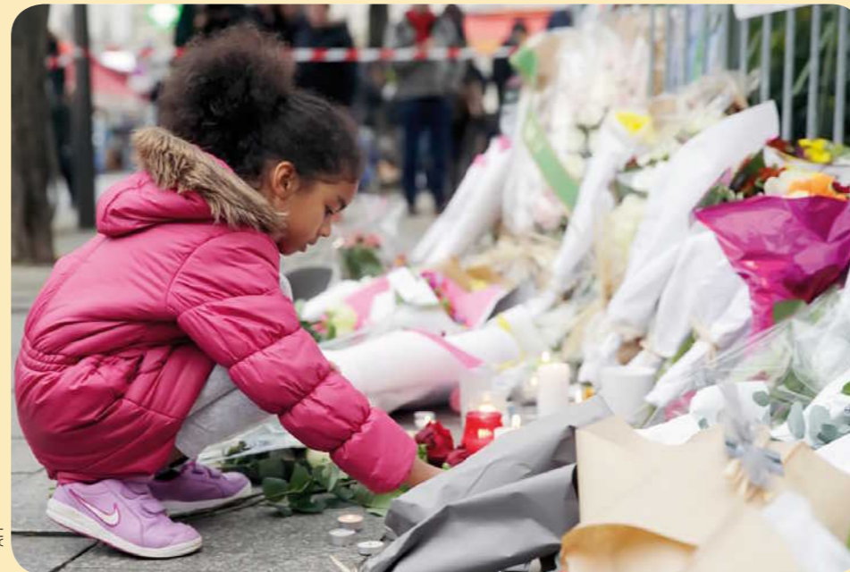
Des hommages. Des personnes déposent des bougies ou des fleurs devant les lieux des attaques ou dans d'autres endroits de Paris.

Dans le monde. Des monuments ont été éclairés aux couleurs du drapeau français. Ici, l'opéra de Sydney, en Australie (Océanie).