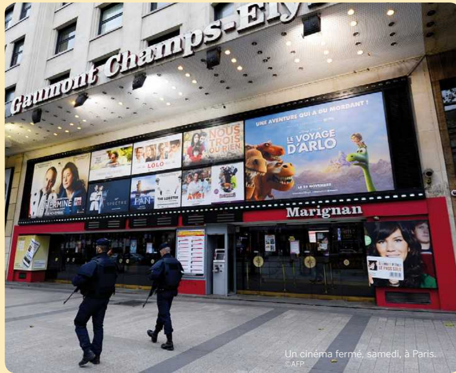
Un cinéma fermé, samedi, à Paris.